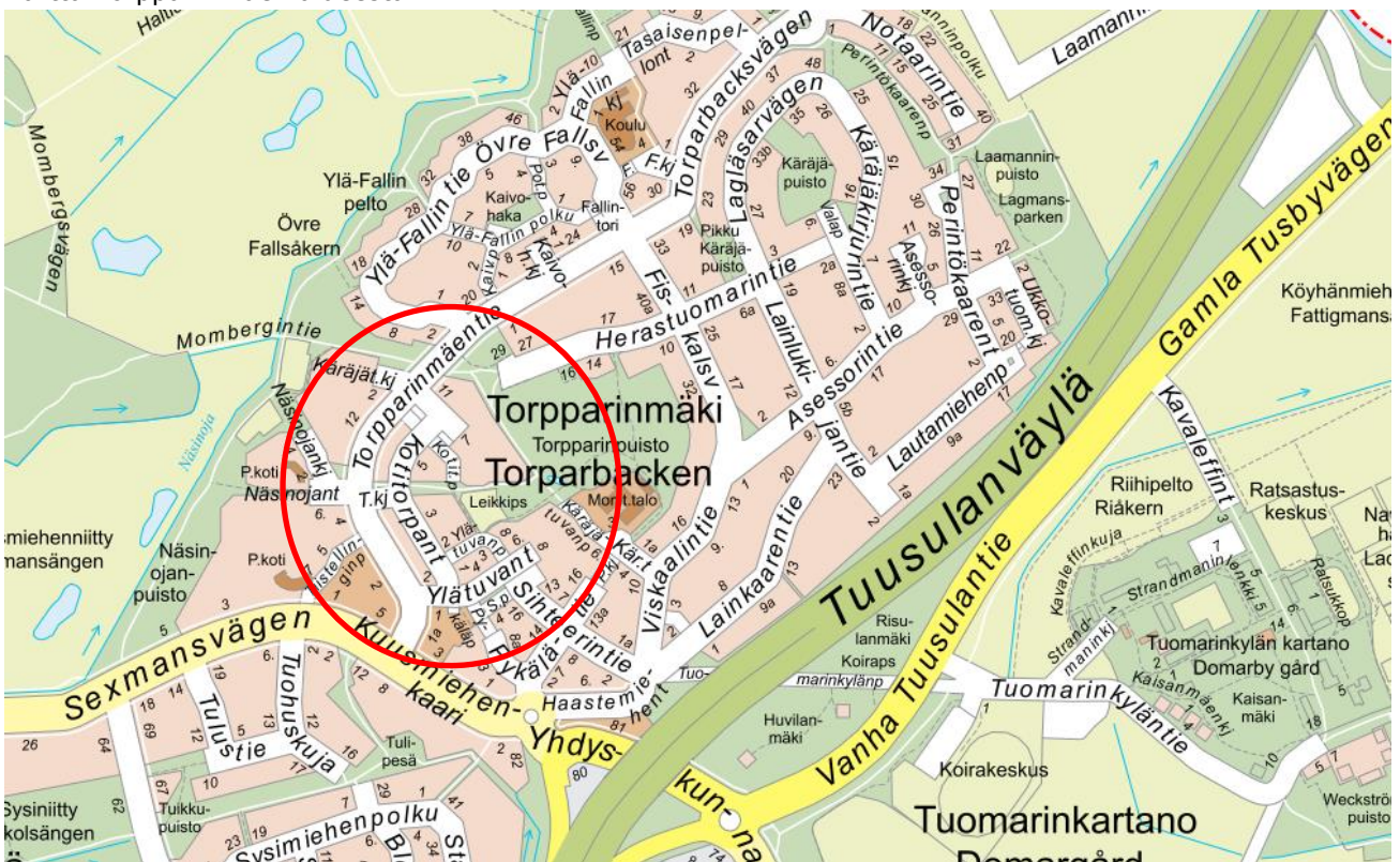
Kartta Torpparinmäen alueesta

KADUT JA KUNNALLISTEKNIikka JORMA HAVUKAINEN 19.10.2017