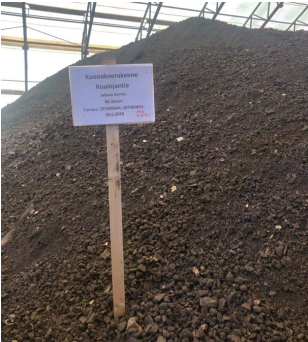
Jakavan kerroksen kuonaa varastokasalla (Kuva: Anniina Söderholm).