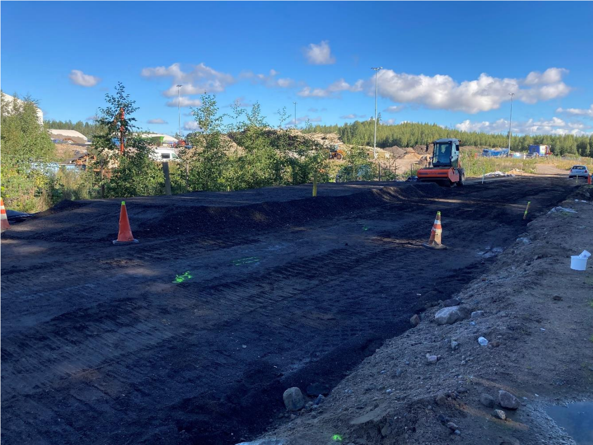
Kuulojantien rakentaminen (Kuva: Marjo Koivulahti).