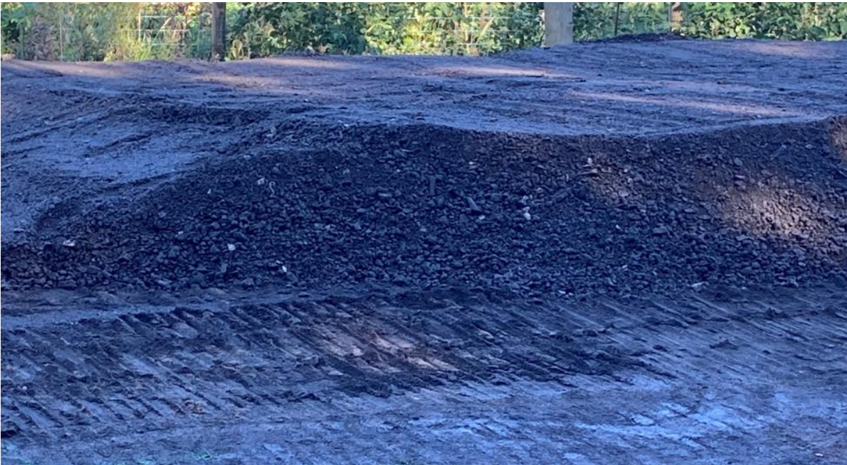
Kuulojantien rakentaminen.